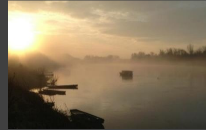
La Vienne - The Vienne River