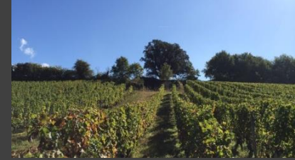
Clos du Chêne Vert

Dinner Menu & Wine Tasting (2:30 hrs) Quote on request