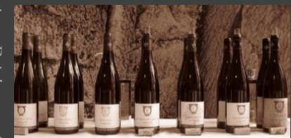
Vins du domaine - Domaine's wines

L'abus d'alcool est dangereux pour la santé, à consommer avec modération - Drink responsibly.