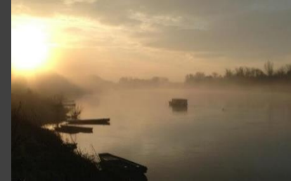
La Vienne - The Vienne River