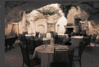
Cave de Tuffeau - Our tuffeau cellar